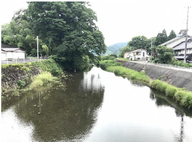
周辺状況（家のすぐ前を穏やかに流れる大江川）