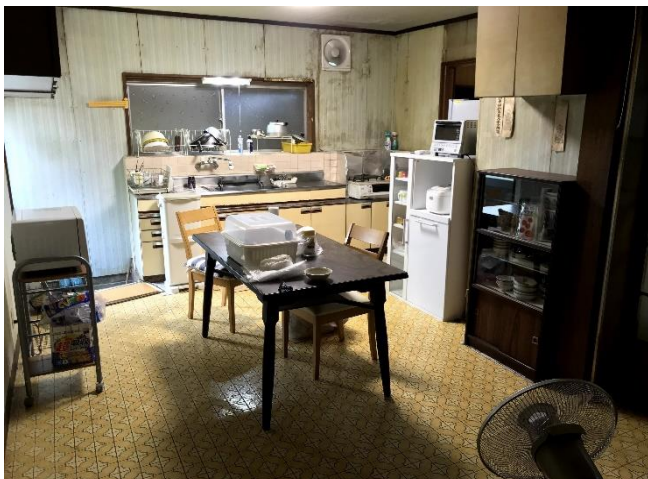
1階ダイニングキッチン