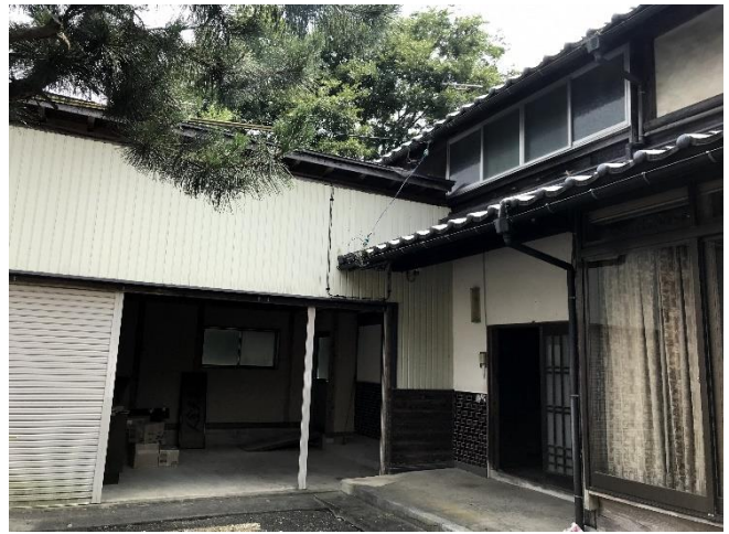
外物置（車庫としても利用可能）